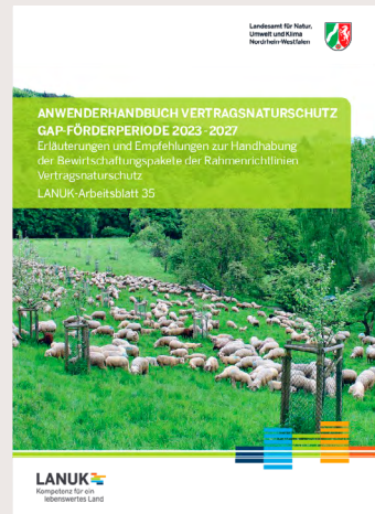
Anwenderhandbuch Vertragsnaturschutz GAP-Förderperiode 2023–2027, LANUK NRW 2025