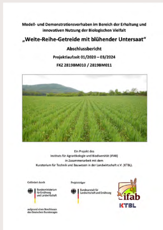
Abschlussbericht Weite-Reihe-Getreide mit blühender Untersaat, ifab 2024