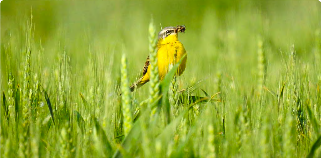
Futtertragende Schafstelze im Getreide mit Weiter Reihe