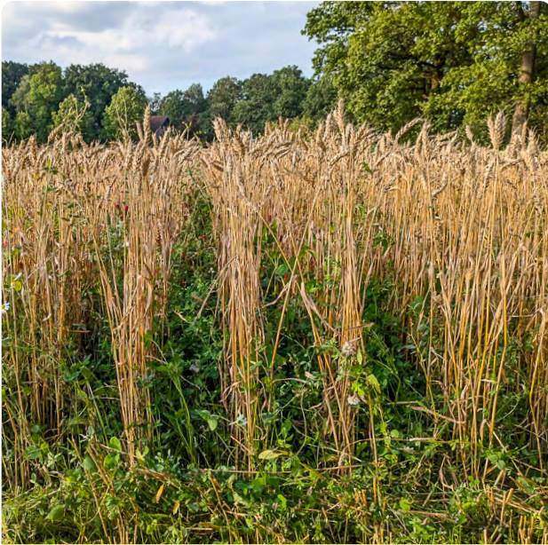
Weite Reihe mit üppiger Untersaat kurz vor dem Dreschen

Reihenabstände von 33 bis 39 cm, in dem zwei Schaafe geschlossen werden, stellen für viele Landwirte eine größere Hürde da, als das Schließen nur eines Schaafe.