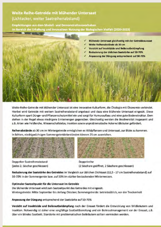
Kurzinfo Weite-Reihe-Getreide mit blühender Untersaat, ifab 2023