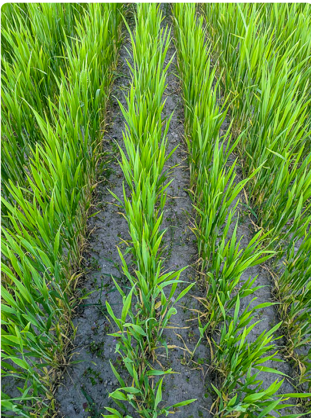
Weite Reihe im Weizen, fünf Wochen nach Drohnenaussaat der Untersaat

Ein hoher Leguminosenanteil in der Untersaat trägt zur Verbesserung der Bodenfruchtbarkeit bei. Eine Überwinterung der Untersaat bietet zudem einen lückenlosen Erosionsschutz, sowie ein Habitat für überwinternde Vögel (Rebhühner, Graumann etc.), Säugetiere und Insekten. Die Landwirtschaft erfährt durch den Blühaspekt im Feld eine Imagesteigerung. Durch Düngerreduzierung und Verzicht auf Pflanzenschutzmitteleinsatz werden Arbeitsgänge und Betriebsmittel eingespart. Die entstehenden Ertrags-einbußen müssen für eine großflächige Akzeptanz der Maßnahme über Förderprogramme ausgeglichen werden.