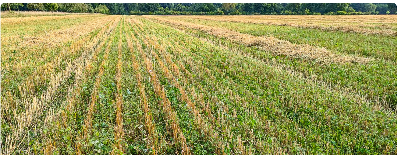
Weite Reihe mit blühender Untersaat nach dem Dreschen

Am besten erfolgt die Ernte im Hochschnitt, um die Untersaat weitgehend zu schonen. Andererseits kann beim Dreschen der Schnitt auch normal erfolgen mit der Folge, dass das Erntegut und Stroh deutlich feuchter ist. Viele der Untersaatarten werden anschließend erneut austreiben. Die Untersaat bleibt nach Möglichkeit über den Winter stehen und wird erst im nächsten Frühjahr umgebrochen. Dadurch entsteht nahtlos ein Winterhabitat für Vögel, Säugetiere und Arthropoden und ein Erosionsschutz ist gegeben. Ggf. kann die Untersaat auch stehenbleiben und als Futterbaufläche genutzt werden oder durch ergänzende Einsaat von Klee gras produktionstechnisch aufgewertet werden.