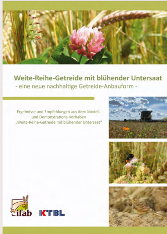
Broschüre Weite-Reihe-Getreide mit blühender-Untersaat, ifab 2024