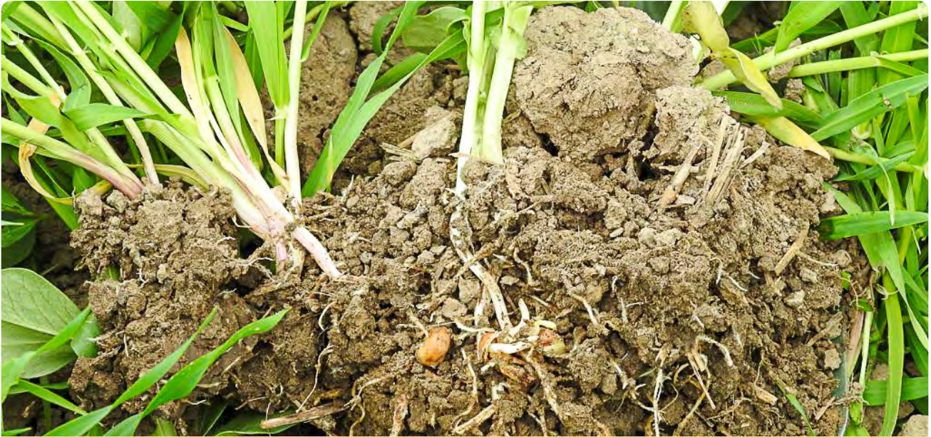
Knöllchenbakterien am Klee