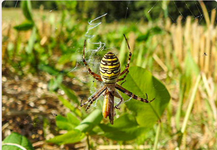
Wespenspinne mit erbeuteter Heuschrecke nach der Ernte der Sommergerste, Selmsdorf 2020